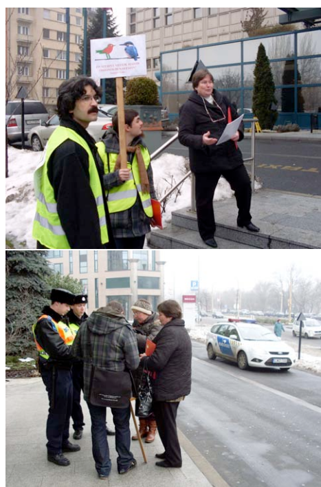
A közveszélyes rendbontók