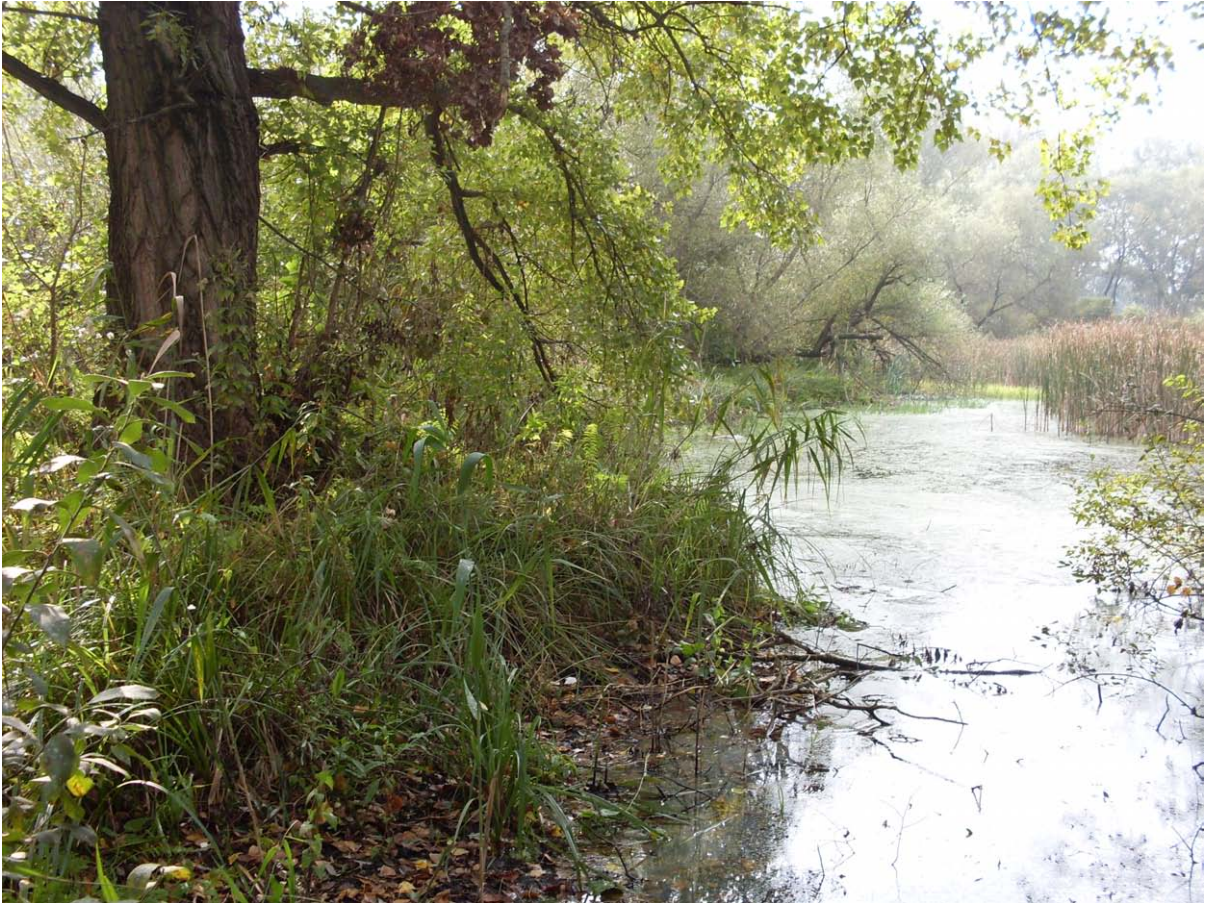
Dunakeszi, tőzegláp, 2009. október vége